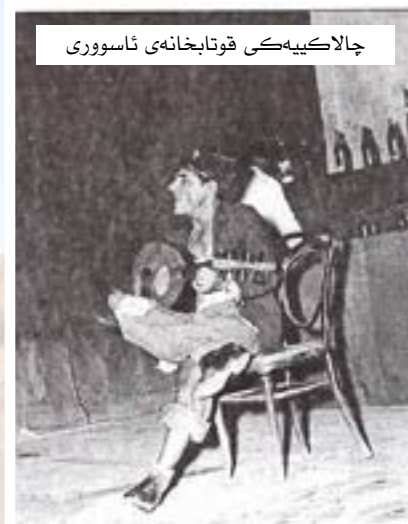
چالاكويهى قوتابخانهى ئاسوورى

ژير ناوى قوتابخانهى ئاسووریدا بوو كه لهماومى تمهنيدا نزيكهى زياتر له ۵۰ ماموستا وانهيان لهو قوتابخانهيه وتوتهوه به كوربان و كچانى ئاسوورى. ئەم گەرپەكەش ومكو گەرپەكهكانى تر كهوتوته بهر گۆرانكارى ئابوورى و بازرگانی و بوونی شهقامى فراوان له نيو گەرپەكهكهدا بووه بههوى رووخاندنى بهشپكى مالهكان و بونياتانى دوكان و مۆلى بازرگانی له جيگهياندا