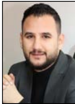
◻ رەوان تالېب

لە سەرۋىبەندى كۆتايى رېبازى كلاسيزم و لە سەدەى رابردوو شاعىرىكى كورد لەشارى كەركوك لەدايك دەيىت و ھەستى كوردموارى و نەتەۋمىي لە ناخيدا گەلەلە دەمكات و روو لەھەلەكشان دەيى، دەرەسەرى و رەنج و تىكۆشانى زۆرى بۆ دەھيىت، لە ھەر كۆى گوزمرانى كرددوو بە بيروباومېرى تەۋاۋى نەتەۋايەتپەۋە كارى كرددوو، ھەر لە پاش ماۋمىيەكى كەم دوردەخريتەۋە لە كارەكەى، مامەند كەركوكى نازناۋى شاعىرى فەرامۇشكراو «مەھمەد رەمىزى عەبدولرەھىمى جاۋفرۆشپە»، سالى ۱۸۹۴ لەكەركوك لەدايك دەيىت و پەلە بەندىيەكانى خويىدن ئەبەيىت و دواجار ئەيىت بە مامۇستا، لە قۇناغى نوپىكەردنەۋمى شىعەرى كوردى دەرەكەۋى وەكو شاعىرىكى نوپىخۋاز ھاوشانى گۆران و شىخ نورى شىخ سالىھ. بەيى و تارىكى دەرەفيق شۋانى لە ژمارە(۵۹۴) ى رۆژنامەى ھەۋال بىلاۋى كەردۆتەۋە ئاماژە بۆ ئەۋەدەمكات كە مامەند كەركوكى يەكەم نوپىكەرمەۋمى شىعەرى كوردىيە لە نيۋمى يەكەمى سەدەى بېستەم، باس لەۋشەدەمكات» نوپىكەردنەۋمى شىعەرى كوردى لە كەركوكەۋە سەرچاۋەى گەرتەۋە شاعىرىكى ۋەك (مامەند كەركوكى)ۋاتە (مىرزى رەھىمى جاۋفرۆش)بە سەرەتاي شىعەرى ناۋمەرەست كە بە قوتابخانەى شىعەرى بابان ناۋدەمبەيىت. شاعىر بەشىكى زۆرى ناۋچەكانى