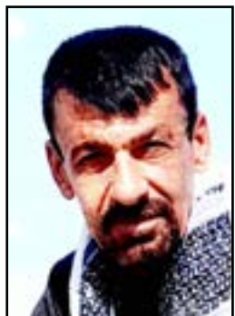
□ گۆران ھەسارى