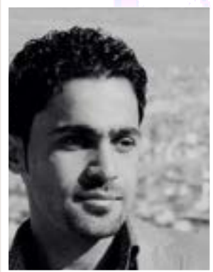
كاروان عوسمان شوانى

دەستەكانم بە دڵشكاوى دەگەراندمو ، وەك ئەو دەرۆزەكەرمى پپى دوتري ، هېچمان نبیە ، خوا بتداتى .