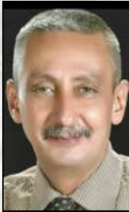
□ * موشي بولص موشي اديب وقاص