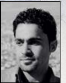
□ کاروان عوسمان شوانی

دادگای بالای تاوانەکان لە عێراق دەرڤەتیکێ زێرین بوو کە تیایدا کەیسێ ئەنفالی لە خۆ گرت.